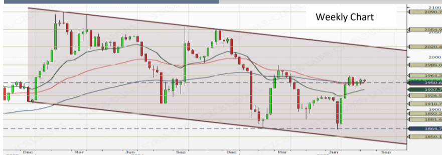
Trend : Short Term ▲