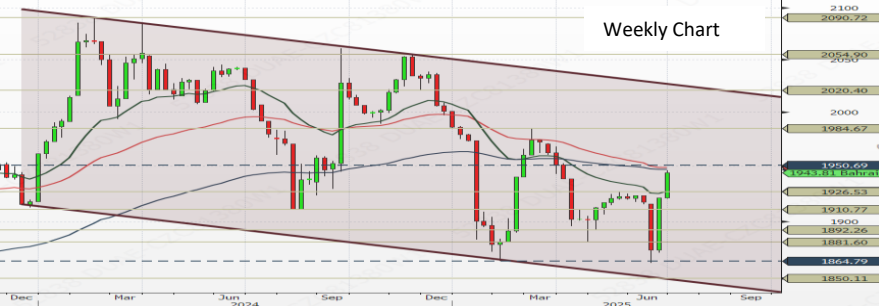
Trend : Short Term ▲