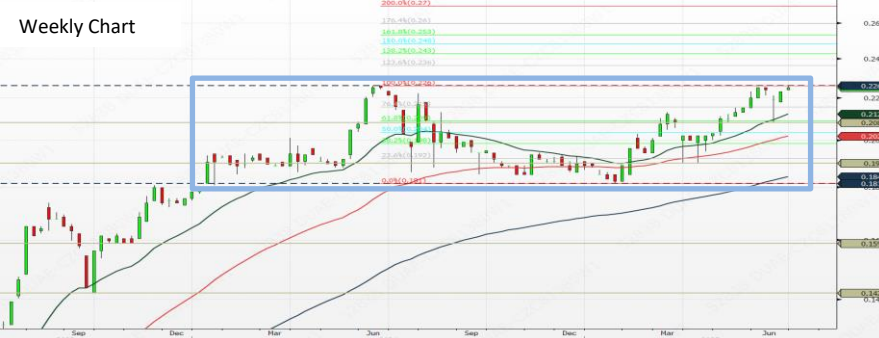
Trading strategy - BUY over BHD 0.226