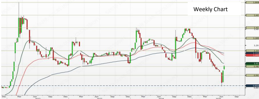
Trading strategy - BUY