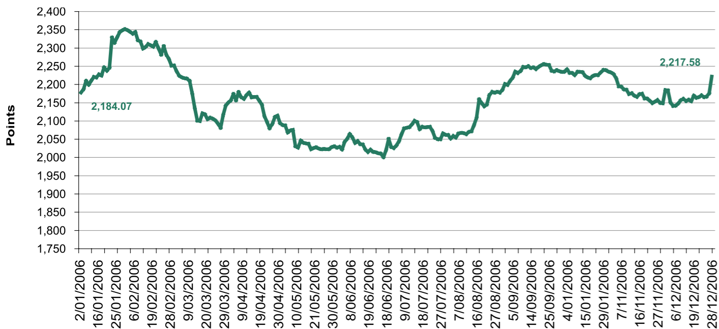
تطور مؤشر البحرين العام خلال عام 2006 ( نقطة ) Bahrain All Share Index Performance During 2006 (Points)

The Bahrain All Share Index closed at the end of the year at 2217.6 points recording yoy growth rate of 0.99%. The stellar performer between the sectors, according to the Bahrain All Share Sub-Indices, was the Commercial Banks Sector that increased by 16.9%. Market Capitalization of the BSE stood at BD 7.9bn by the end of the year, increasing from BD 6.5bn in 2005, achieving by that a growth of 21.6%. The Investment Sector recorded the biggest growth among the sectors, where the market capitalization grew by 34.8% increasing from BD 2.7bn in 2005 to BD 3.6bn in 2005.